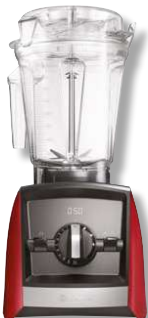
Ascent 2500i VTX A2500 RD