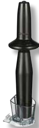
Supporto per Tamper Ascent VTX 064585