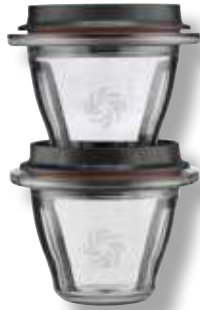
Set Due Ciotole