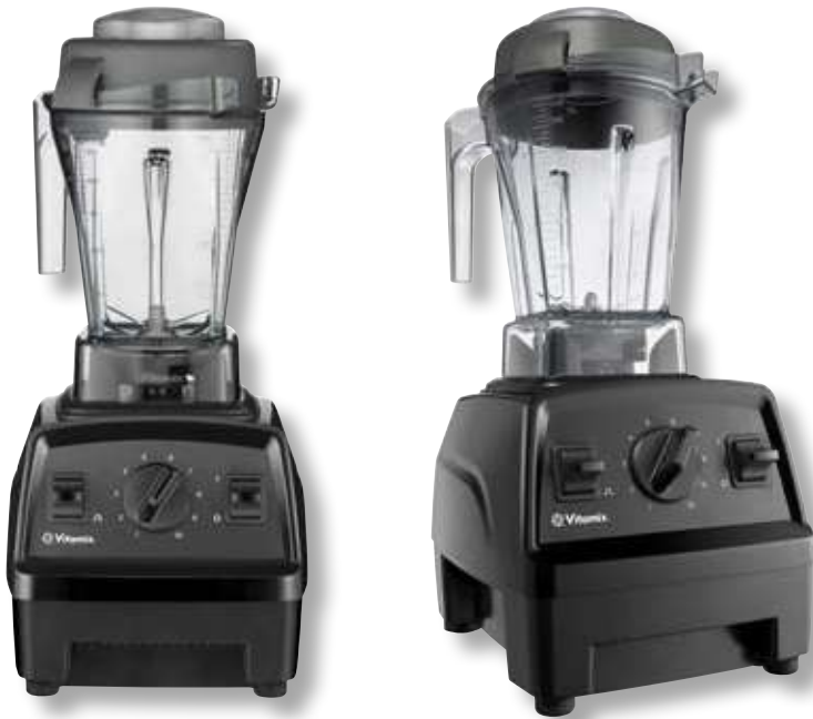
Vitamix Explorian 310 BK