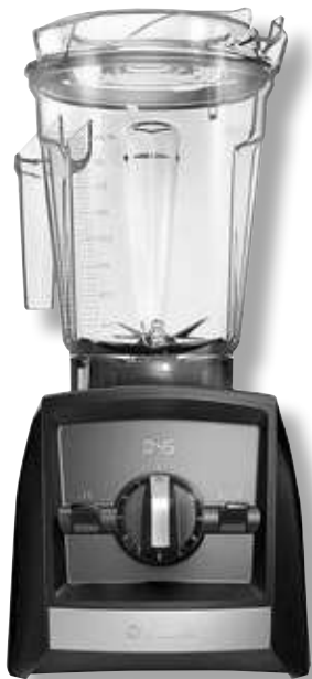
Vitamix Ascent 2300i VTX A2300 BK