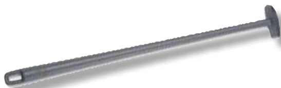
Under Blade Scraper VTX 064584