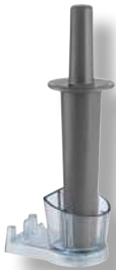
Supporto per Tamper E310 VTX 065471