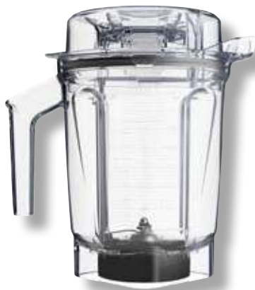
Boccale Interlock Ascent™