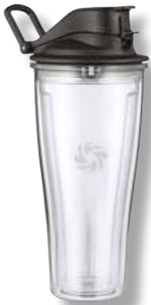
Mix&amp;go Container S-30