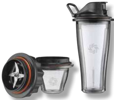
Starter Kit Bicchiere e Ciotola