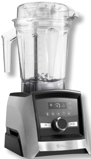
Ascent 3500i VTX A3500 SV