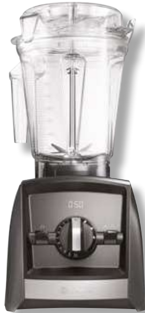
Ascent 2500i VTX A2500 GY