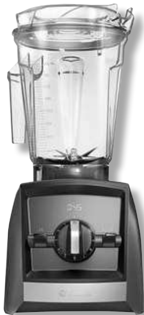
Vitamix Ascent 2300i VTX A2300 GY