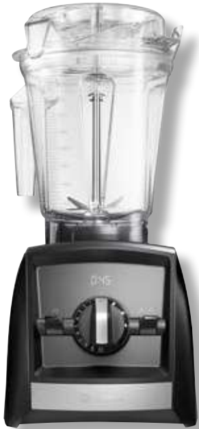
Ascent 2500i VTX A2500 BK