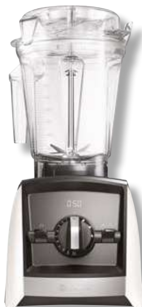
Ascent 2500i VTX A2500 WH