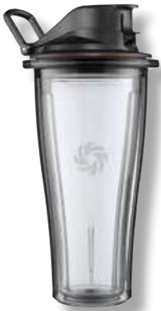
Bicchiere To Go