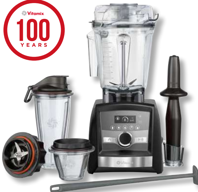
Set Anniversario VTX 069771