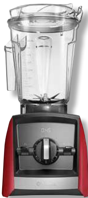
Vitamix Ascent 2300i VTX A2300 RD