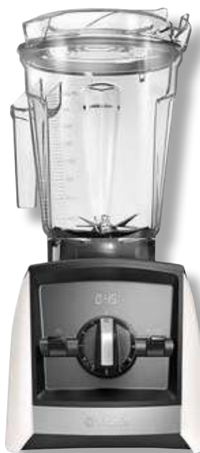
Vitamix Ascent 2300i VTX A2300 WH