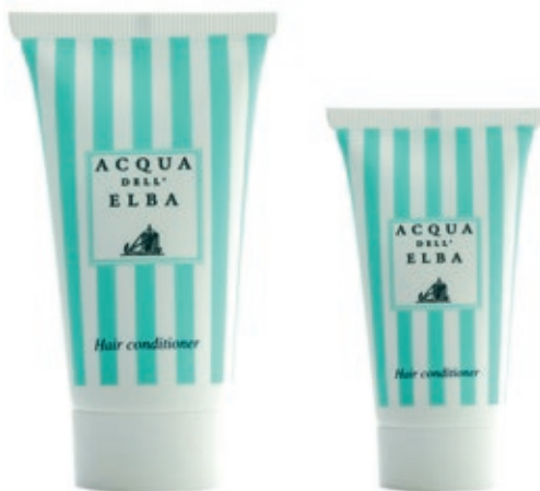
Hair conditioner 50 ml. (Cod. 17Y) 100 ml. (Cod. 21Y)