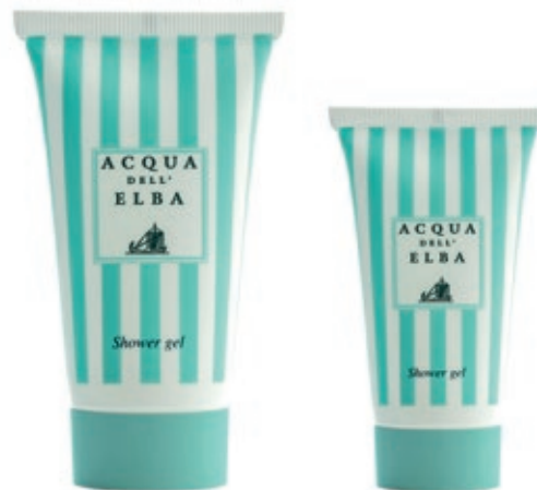
Shower gel 50 ml. (Cod. 15Y) 100 ml. (Cod. 19Y)