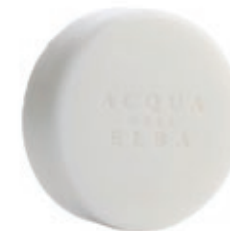
Sapone Idratante, 50 g. (Cod. 22Y)