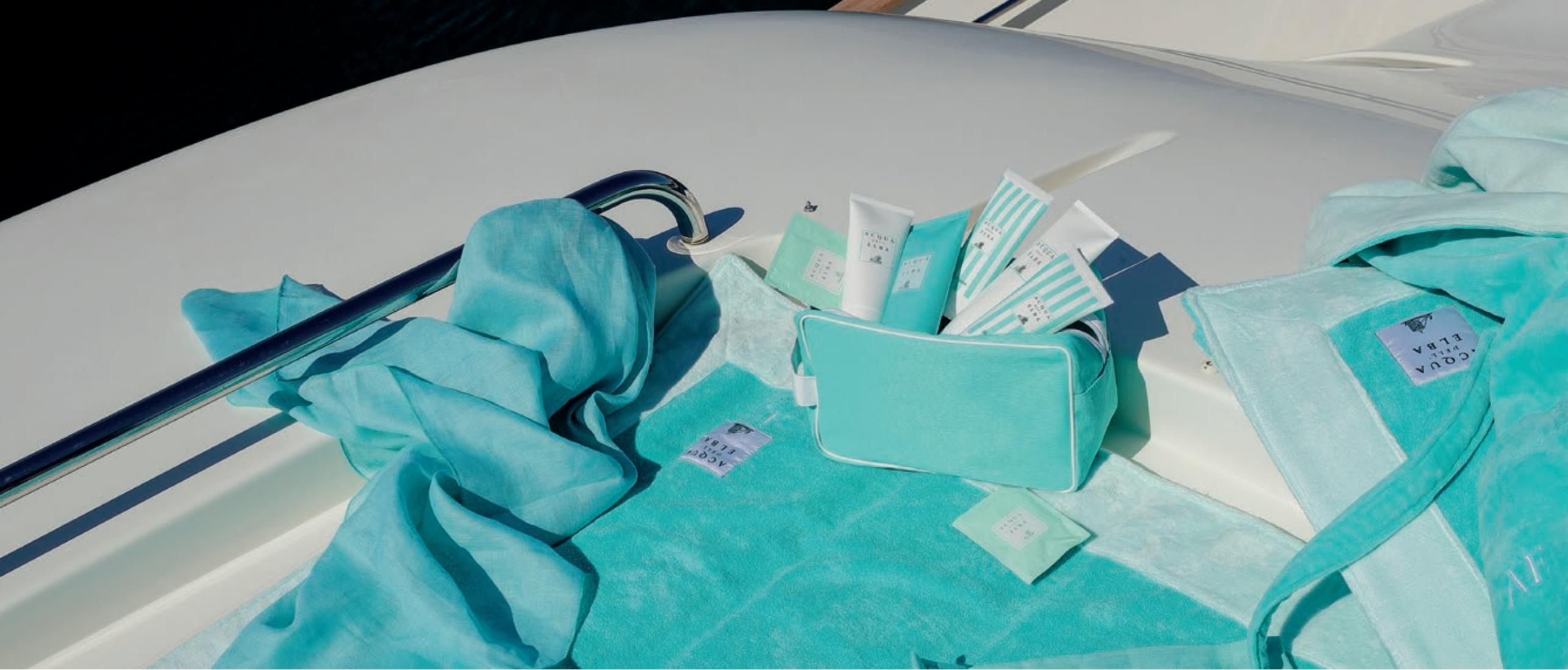
Linea bagno Yachting