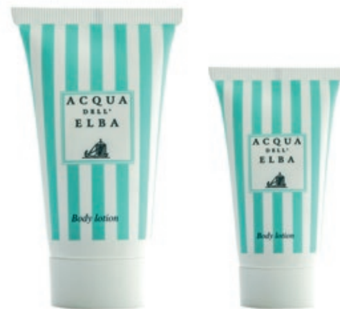
Body lotion 50 ml. (Cod. 14Y) 100 ml. (Cod. 18Y)