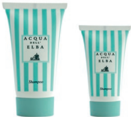
Shampoo 50 ml. (Cod. 16Y) 100 ml. (Cod. 20Y)