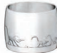
B04260640 H : 3,2 cm – 1 17/64” Ø : 4,3 cm – 1 11/16”