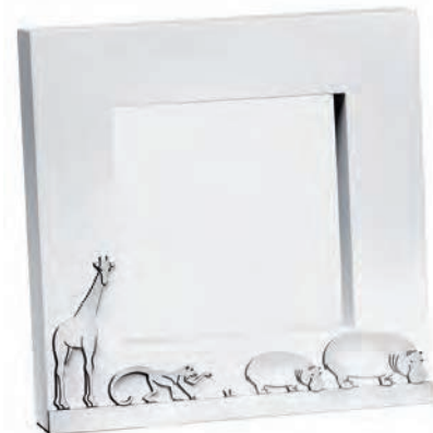
B04256985 Bois & métal argenté verni Wood & varnished silver plated H x L : 9 x 9 cm H x L : 3 9/16 x 3 9/16” Cadre à photo Picture frame