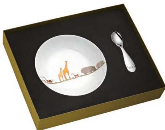
B07754010 Porcelaine & métal argenté Porcelain & silver plated Coffret assiette à bouillie et cuillère bébé Baby spoon and baby plate set