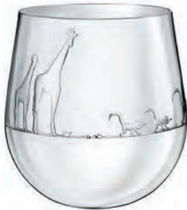
B04260630 H : 8 cm – 3 1/7” Ø : 6,3 cm – 2 1/3”