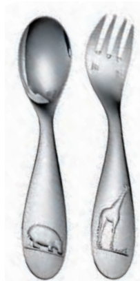
B00079314 L : 13 cm – 5 1/8” Ensemble 2 couverts naissance Flatware set for baby (2 pieces)