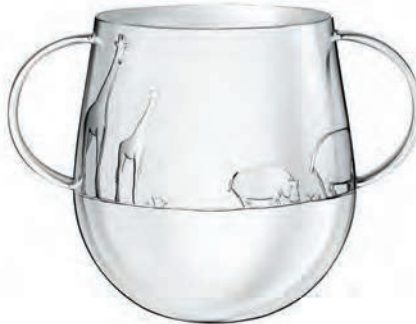
B04260635 H : 8 cm – 3 1/7” Ø : 6,3 cm – 2 1/3”