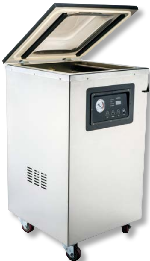
Campana alta per sottovuoto a pompa d'olio