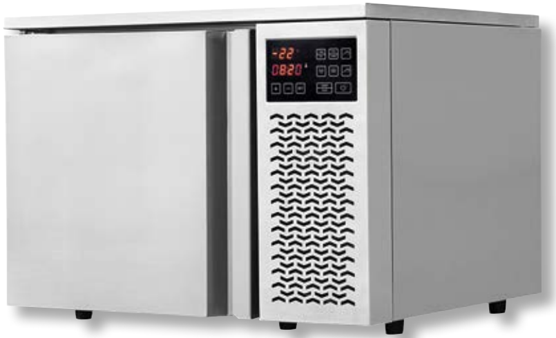
Abbattitore VST BF200 SS