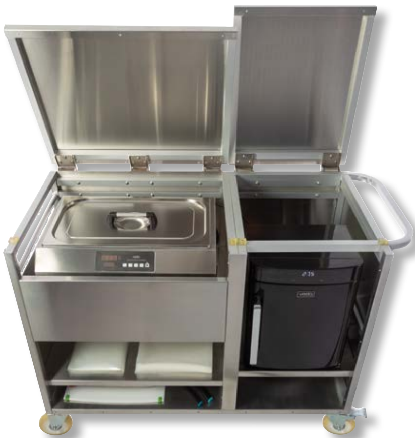
Stazione mobile sousvide