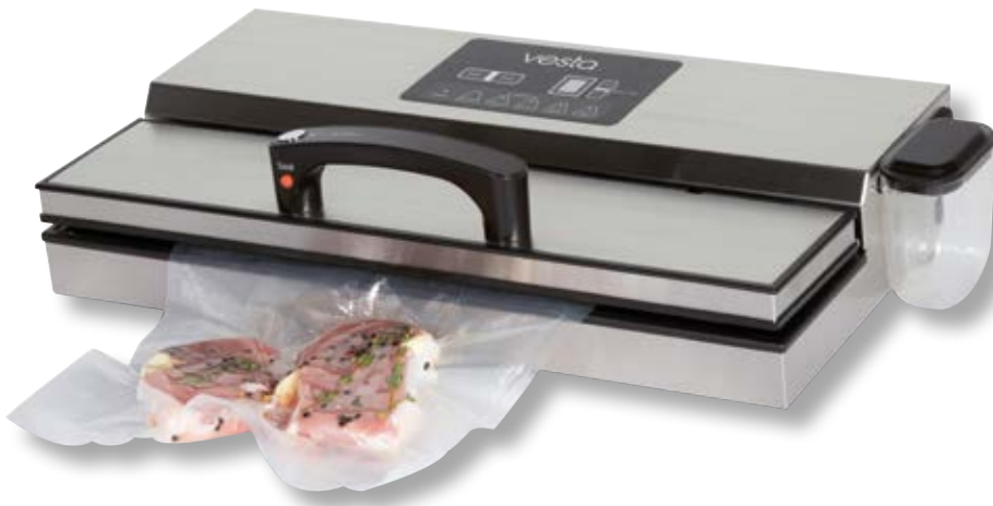
Barra per sottovuoto VST YJS781C