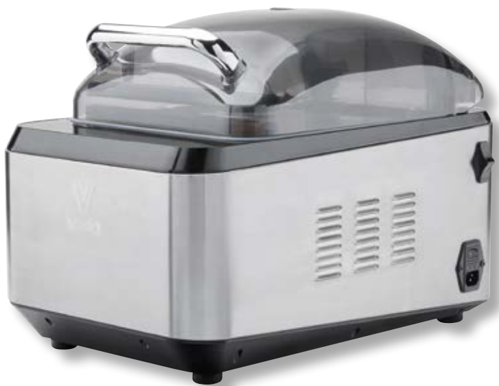
Campana per sottovuoto ad olio