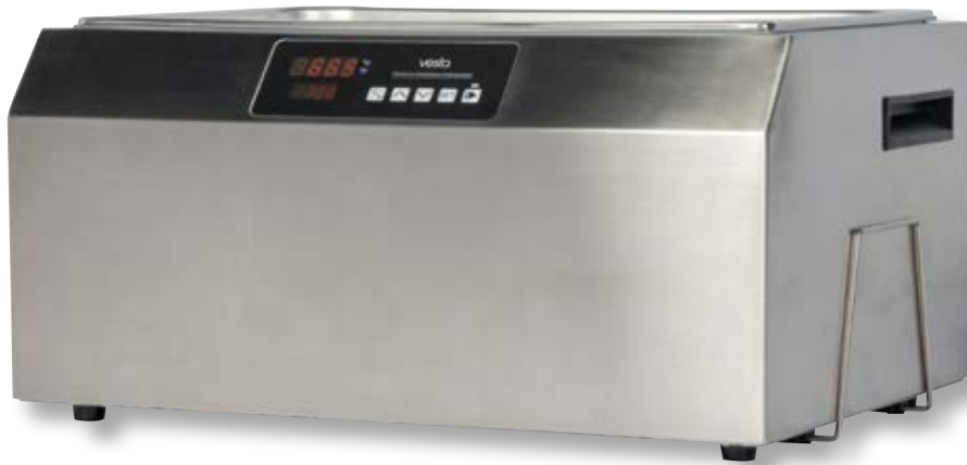
Vasca cottura sottovuoto VST SV251