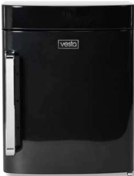
Campana per sottovuoto verticale VST V40 BK