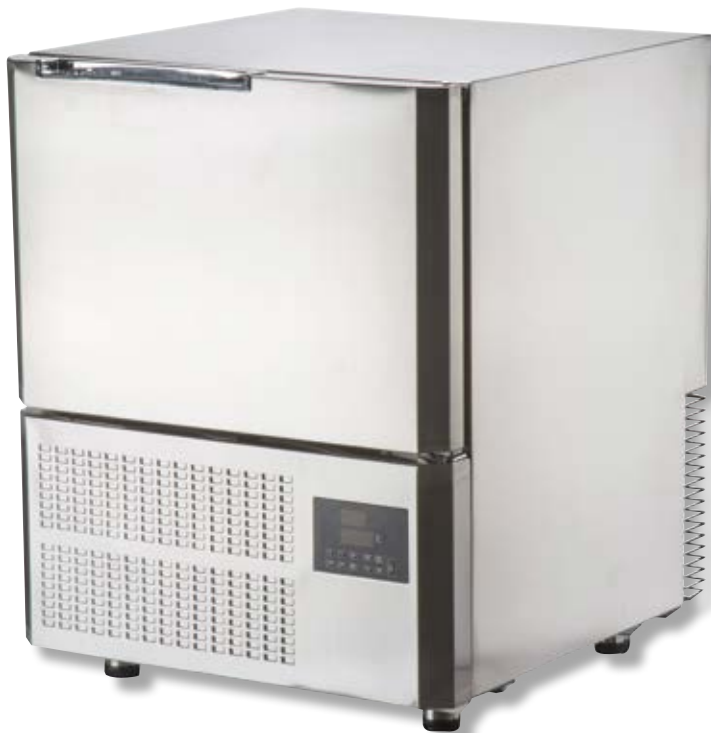
Abbattitore VST BF300 SS

Congelamento x 4 kg di alimenti: 240 min.