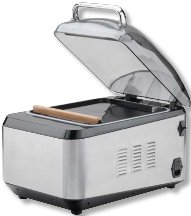
Campana per sottovuoto ad aria