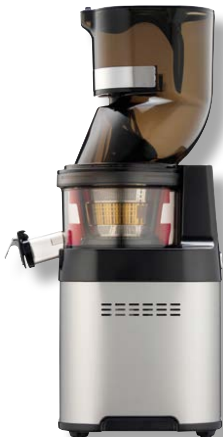
Whole Slow Juicer Chef