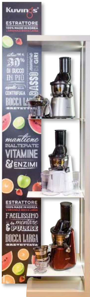
K- EXPO KVG T