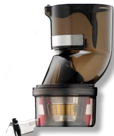
Testa intera per Juicer Chef